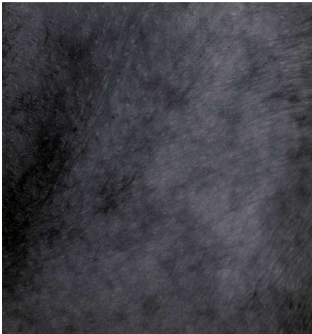
ABB. 10: HANS DANUSER, TRIPTYCHON »VANITAS«, 2003 9-TEILIG (I 1 – I 3, II 1 – II 3, III 1 – III 3) FOTOGRAFIE, PIGMENT AUF PAPIER, JE 140 × 150 CM BILD: BILDTABLEAU III 2, COURTESY MUSEE SUISSE