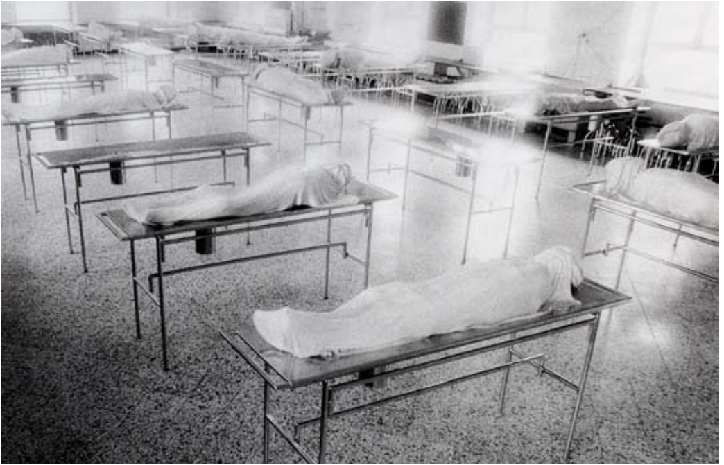
ABB. 2: ANATOMIESAAL

HANS DANUSER, »MEDIZIN I«, TEIL DES »IN VIVO«-ZYKLUS, 1980 – 1989