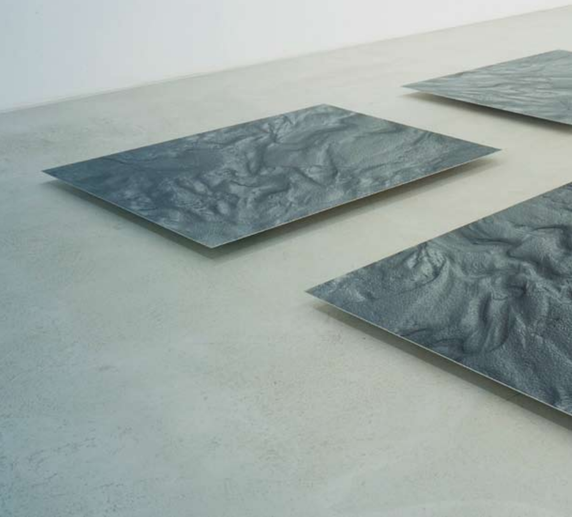
ABB. 16: HANS DANUSER, »EROSION II« EINE BODENINSTALLATION, 2000 – 2006 6-TEILIG ( II 1 – II 6 )

FOTOGRAFIE AUF BARYTH PAPIER, AUFGEZOGEN AUF ALU 2MM, JE 150 × 140 CM