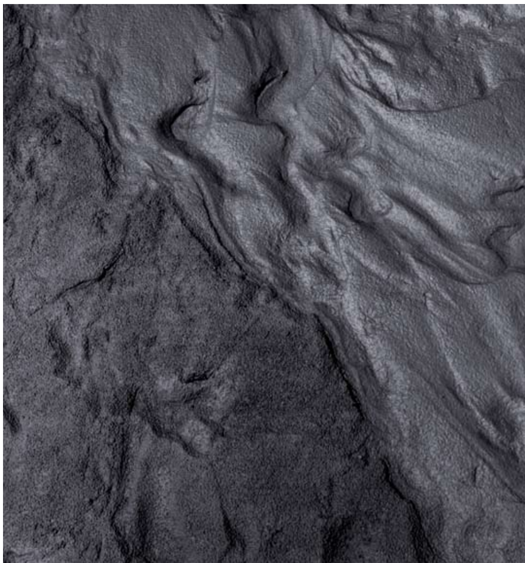
ABB. 13: HANS DANUSER, »EROSION II« EINE BODENINSTALLATION, 2000 – 2006 6-TEILIG ( II 1 – II 6 )

FOTOGRAFIE AUF BARYTH PAPIER, AUFGEZOGEN AUF ALU 2MM, JE 150 × 140CM