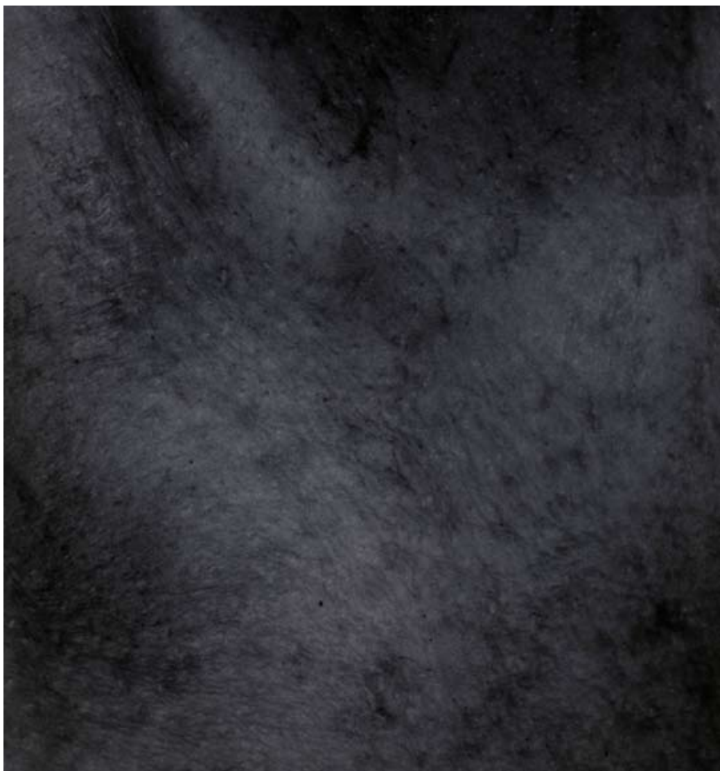
ABB. 7: HANS DANUSER, TRIPTYCHON »VANITAS«, 2003 9-TEILIG (I 1 - I 3, II 1 - II 3, III 1 - III 3) FOTOGRAFIE, PIGMENT AUF PAPIER, JE 140 × 150CM BILD: BILDTABLEAU I 1, COURTESY MUSEE SUISSE