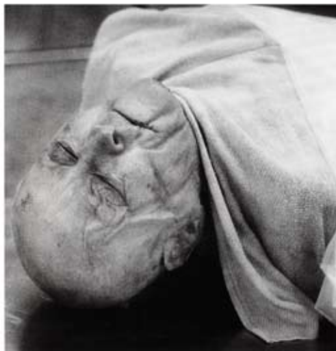
ABB. 5: HANS DANUSER, TRIPTYCHON ANATOMIE