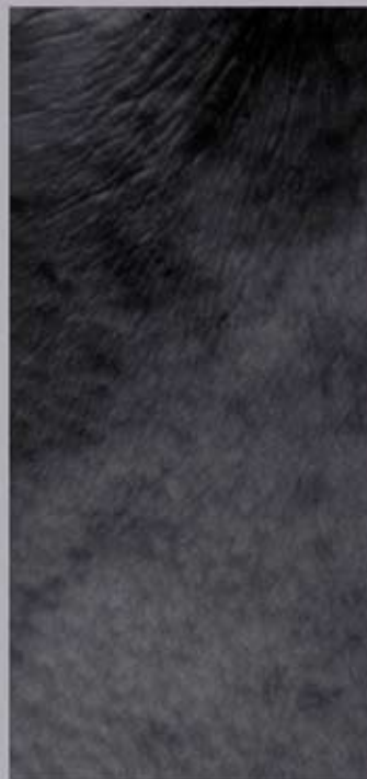
ABB. 8: HANS DANUSER, TRIPTYCHON »VANITAS«, 2003

9-TEILIG (I 1 – I 3, II 1 – II 3, III 1 – III 3)