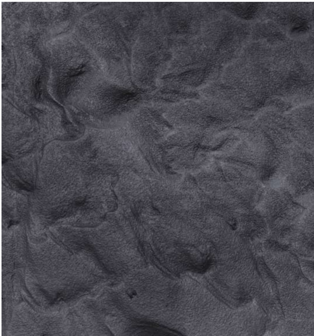
ABB. 11: HANS DANUSER, »EROSION II« EINE BODENINSTALLATION, 2000–2006 9-TEILIG (III 1 – III 9)

FOTOGRAFIE AUF BARYTH PAPIER, AUFGEZOGEN AUF ALU 2MM, JE 150 × 140 CM