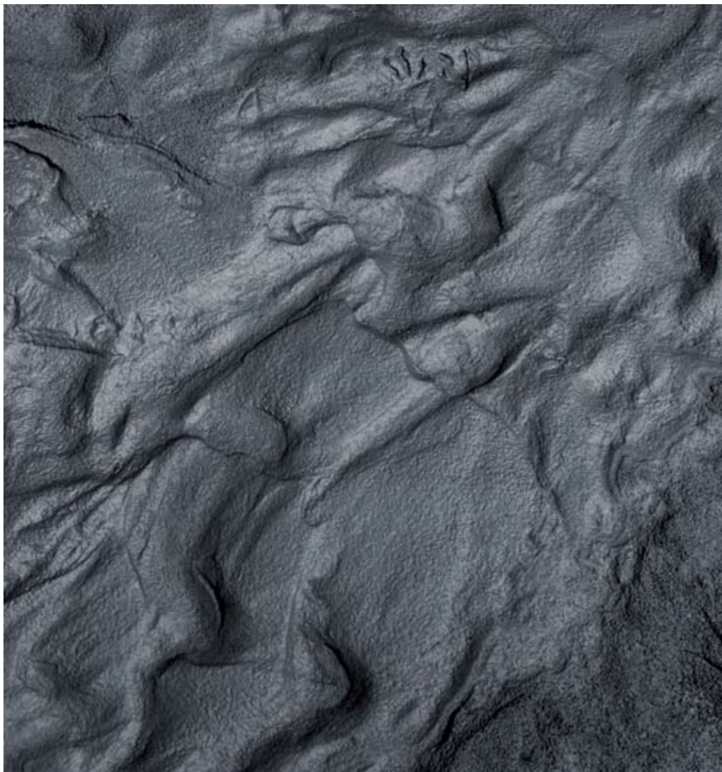
ABB. 15: HANS DANUSER, »EROSION II« EINE BODENINSTALLATION, 2000 – 2006 6-TEILIG (II 1 – II 6)

FOTOGRAFIE AUF BARYTH PAPIER, AUFGEZOGEN AUF ALU 2MM, JE 150 × 140 CM