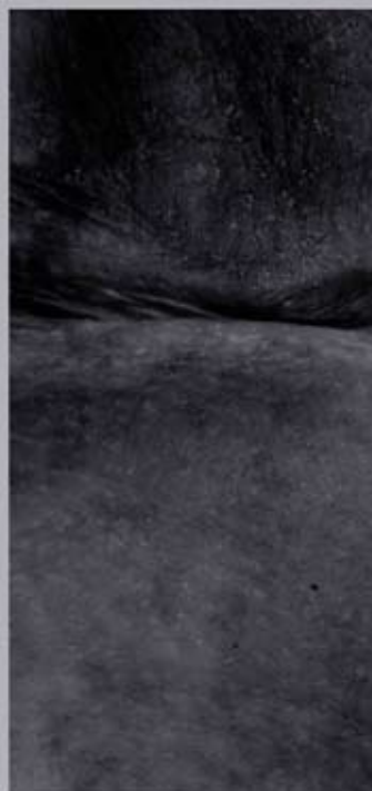
ABB. 1: HANS DANUSER, TRIPTYCHON »VANITAS«, 2000

9-TEILIG (I 1 – I 3, II 1 – II 3, III 1 – III 3)